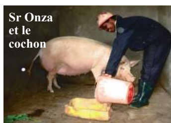
Sr Onza et le cochon