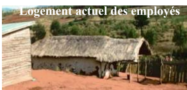
Logement actuel des employés