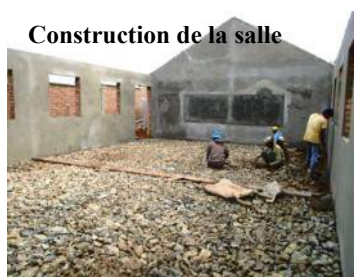
Construction de la salle