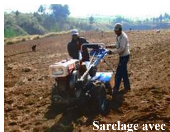
Sarclage avec le nouveau motoculteur